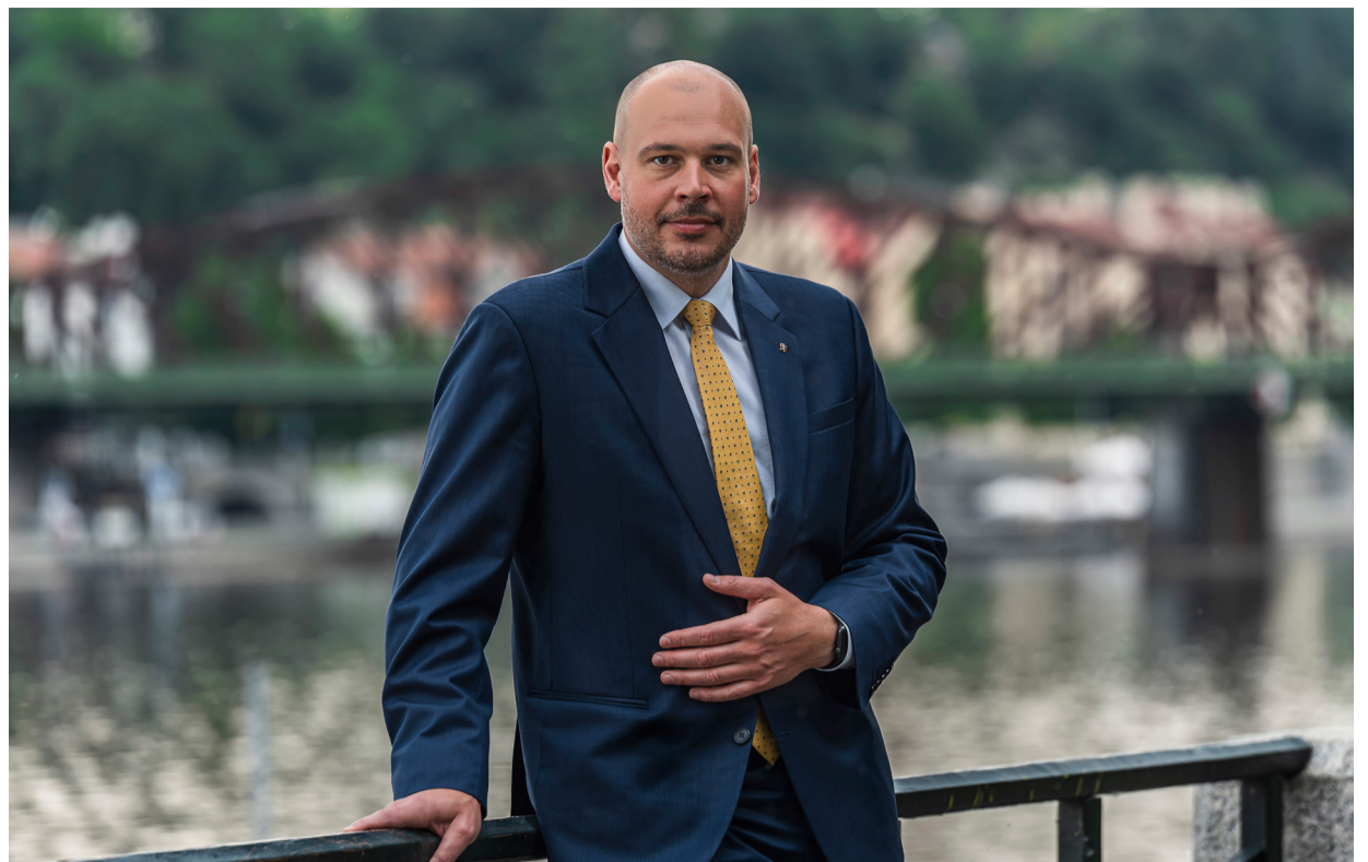
Mgr. František Boháček, ústřední ředitel České správy sociálního zabezpečení

Dlouho do budoucna není možné předvídat vývoj inflace a parametrů výpočtu důchodu včetně výdělků pojištěnce. Proto bude kalkulačka reflektovat pouze dosud známé faktory a predikce bude prováděna pouze u rozsahu v budoucnu získaných dob důchodového